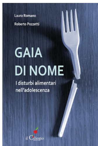
Gaia di nome I disturbi alimentari nell'adolescenza

La manifestazione per il suo valore culturale e scientifico ha ottenuto il patrocinio di molte istituzioni ed enti tra cui la Regione Lombardia e la Provincia di Como. La partecipazione è gratuita, ma è consigliata l'iscrizione attraverso l'indirizzo di posta elettronica info@villasmaria.org oppure telefonando allo 031.426042